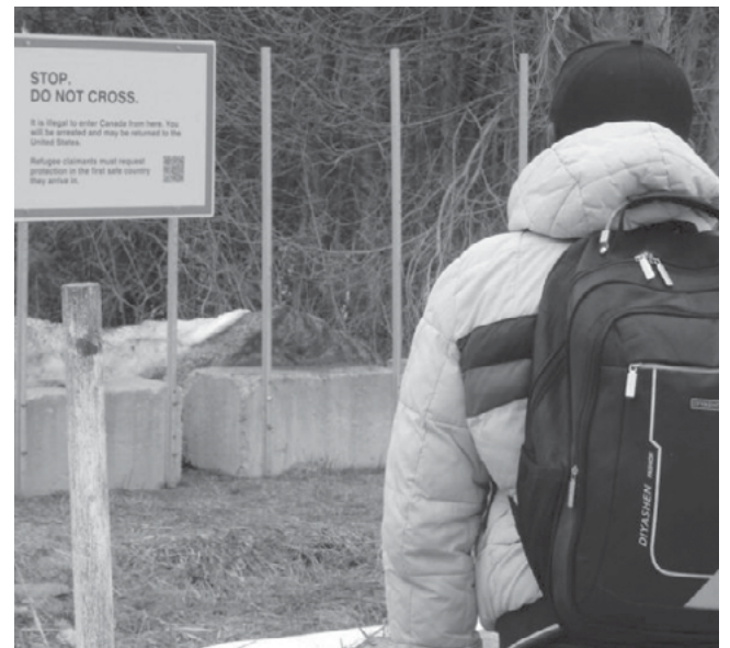
A migrant is pictured at the unofficial border crossing into Canada at Roxham Road.

David Gordon Koch is a journalist with the NB Media Co-op. This reporting has been made possible in part by the Government of Canada, via the Local Journalism Initiative.